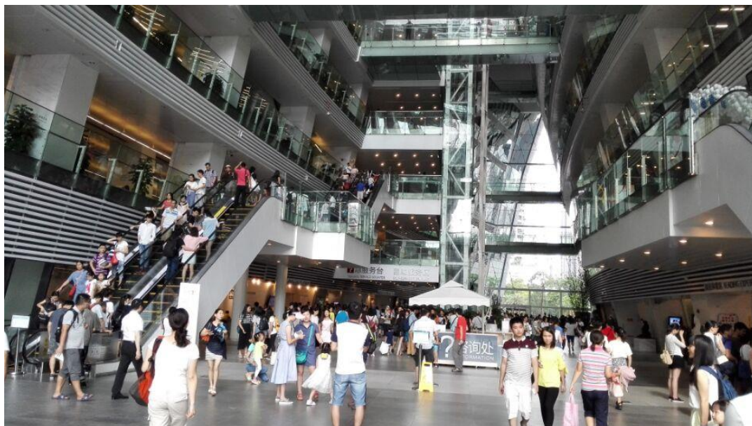
广州图书馆

河北工*：“很少接触公共馆，感觉现在发展比高校馆好。”广州书童：“到 16:00，到馆人数 24,449。”图谋：“这个流量，确实相当了得。”河北工*：“今天？”图谋：“或许会是 TOP5 之内？”广州书童：“在中国不是 top5 之内，是 top1。”图谋：“因为不清楚国家图书馆、首都图书馆、中山图书馆等馆的情况，因此存疑。”广州书童：“因为我知道他们的情况，所以不用存疑。”图谋：“接下来就要 PK 投入情况了。”广州书童：“他们的也算可观，不过比我们差一大截，起码少 200 万/年。”图谋：“国家图书馆、上海图书馆在远程服务方面做得挺扎实。”gaozy：“国图、上海图书馆远程服务我觉得确实是非常好。作为受益者之一，我要点赞。”广州书童：“我们的数字资源少，但是我们的也是全面开放的。都不用到馆办证，只要网络注册，认可就能够使用。要论开放性，咱也不迟疑。”gaozy：“我倒是在想，是不是可以有个图书馆就是做实体服务。网络上的资源难道很有必要每家都买，重复建设吗？我倒是存疑的。”广州书童：“我们的资源全市公共图书馆通用。”图谋：“公共馆之间的资源与服务，给我的印象是，差距真不小。”印度阿三：“我上午看了一下，11 点左右，进馆 6849 人，在馆 3984 人，全天估计在 15000 左右。”图谋：“上个周日，某省馆 16:30 左右，到馆人数是 8793 人，大约是公共图书馆的 1/3。我刚才还翻看了上海图书馆 2015 年 5 月 13 日 15:00 左右的数据，借出总册次 39071，还入总册次 42483。一天的借还量与部分高校馆一年的借还量相当。”广州书童：“上海我如果没有搞错的话应该是上海中心图书馆的数据，是连入系统的所有图书馆。”图谋：“我当时看到这个展示，给我有一种‘视觉冲击’感。”洞庭水手：“如何看这个实时数据呢？这个东西很好，我们新馆也准备上这么一个东西。”