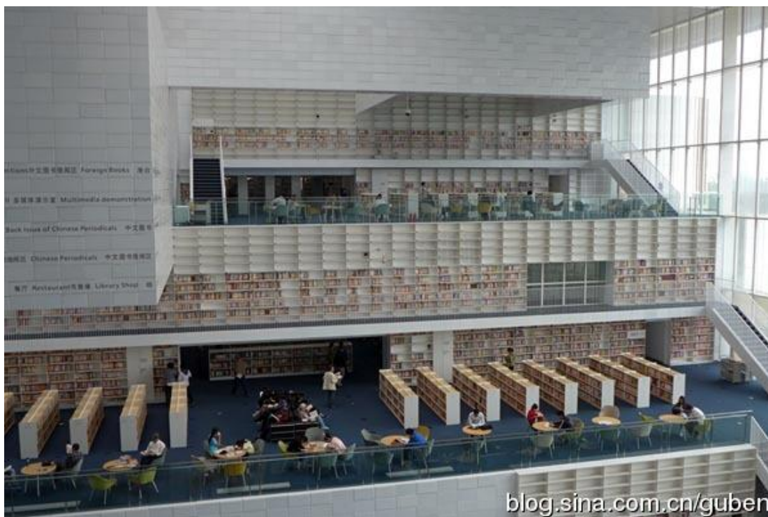
天津图书馆照片，出自书蠹精的博客

http://blog.sina.com.cn/s/blog_495d62640102uy7i.html