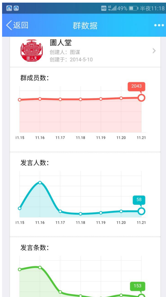
圖人堂群数据表现图