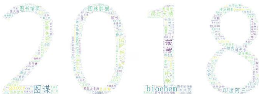
圖人堂 2018 年群交流云图 2 （群成员“图情在读研究生”制作）