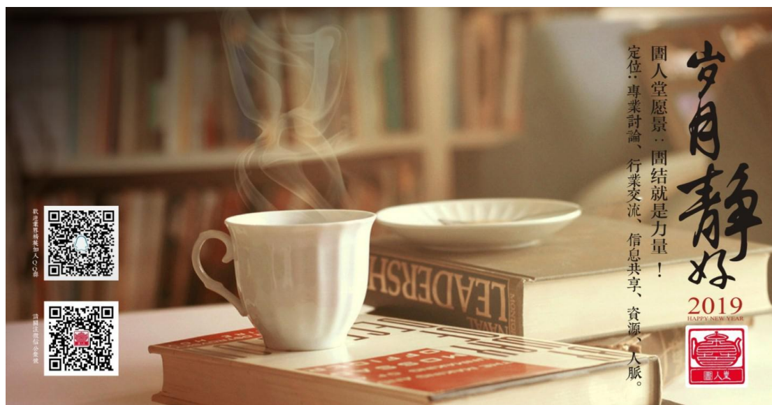
贺卡由圖人堂成员“2014”制作