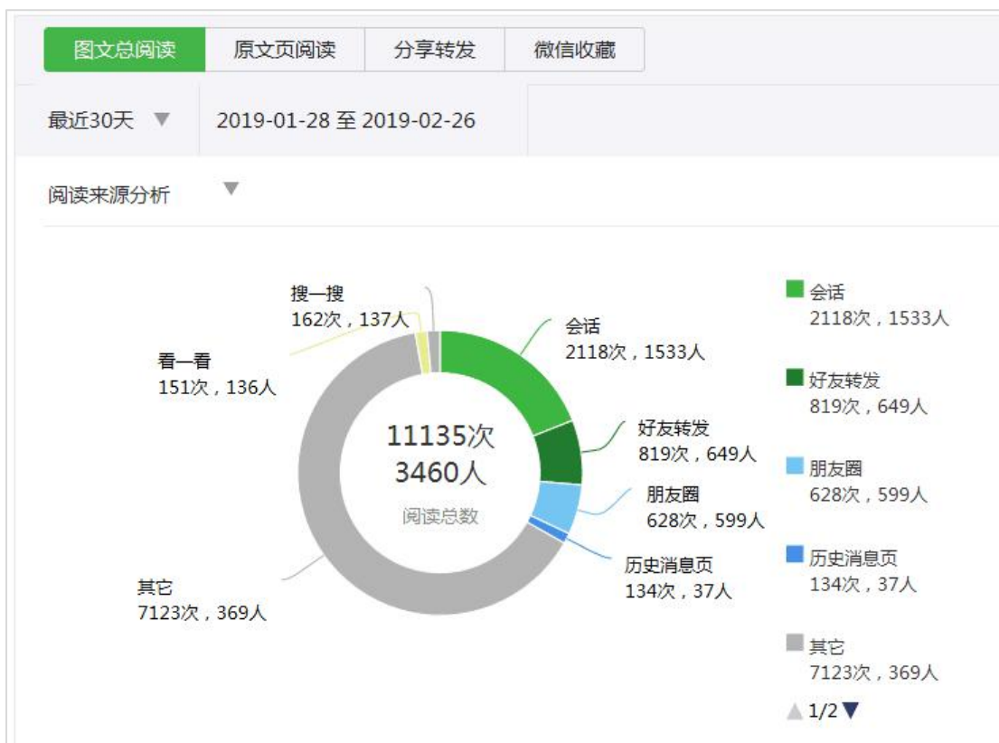
2月26日團人堂微信公众号数据表现