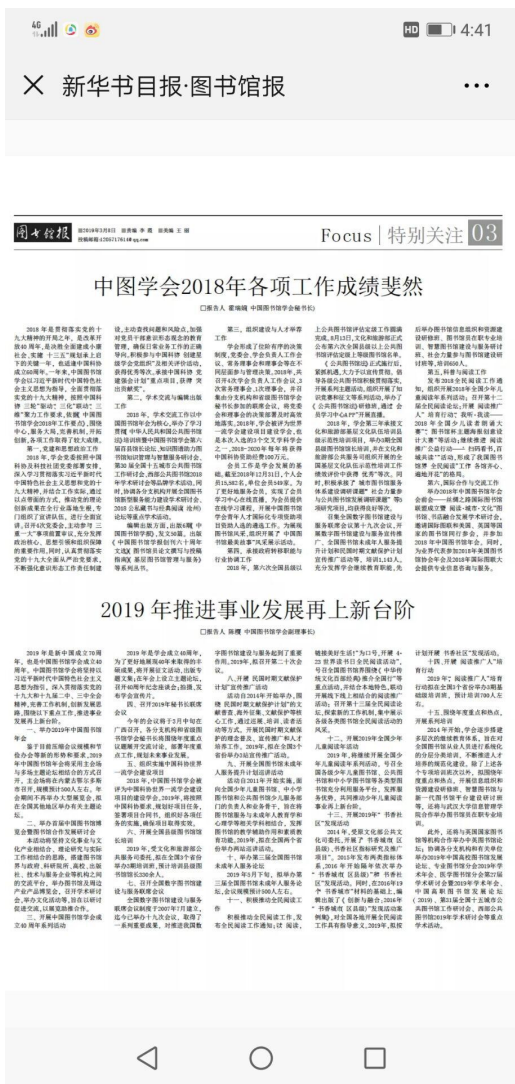
图谋：“图书馆报微信中的电子报更新至今天。”

图谋：“转贴今日《图书馆报》刊发的中国图书馆学会 2018 年工作小结及 2019 年工作计划。从中可以 get 到一些信息，比如：（1）《中国图书馆学报》2018 年发文 50 篇；（2）截至 2018 年 12 月 31 日，中图学会个人会员 15582 名；（3）2019 年中图年会将于内蒙古鄂尔多斯市举办（规模 500 人左右），年会期间不再大型展览会……。”