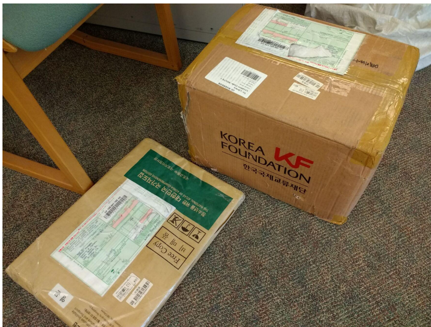
麦子：“韩国的书多一些，重一倍样子。”

麦子：“因为打包差，以前收到的书，不少是书脊开裂的。韩国的里面都用新的纸填满空隙，所以没有这个问题。”