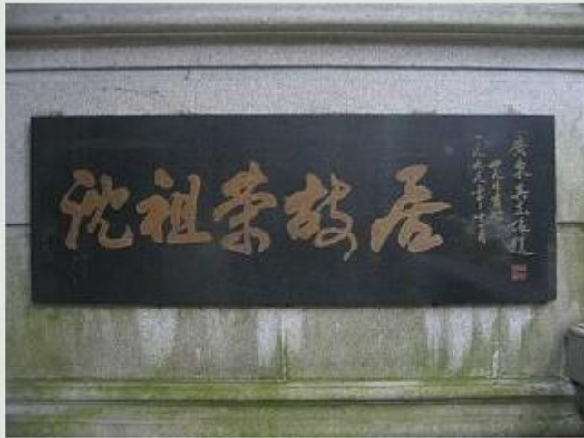
沈祖荣故居牌匾，吴志俭题写。