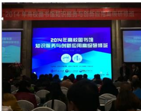
2014 年高校图书馆知识服务与创新应用高级研修班现场