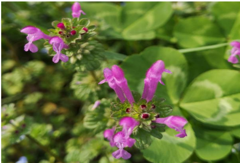
图谋：“栗茂腾.霓裳片片晚妆新，束素亭亭玉殿春！好艳的辛夷花！”

http://blog.sciencenet.cn/blog-421287-1222446.html 。”