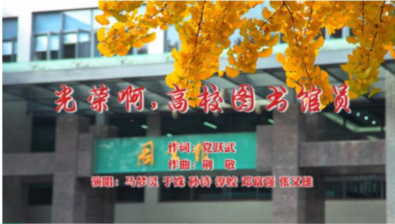
四川大学图书馆 《光荣啊，高校图书馆员》 (一等奖)