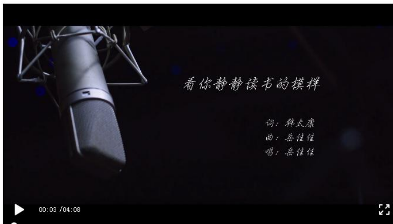
四川音乐学院图书馆 《看你静静读书的模样》 (一等奖)