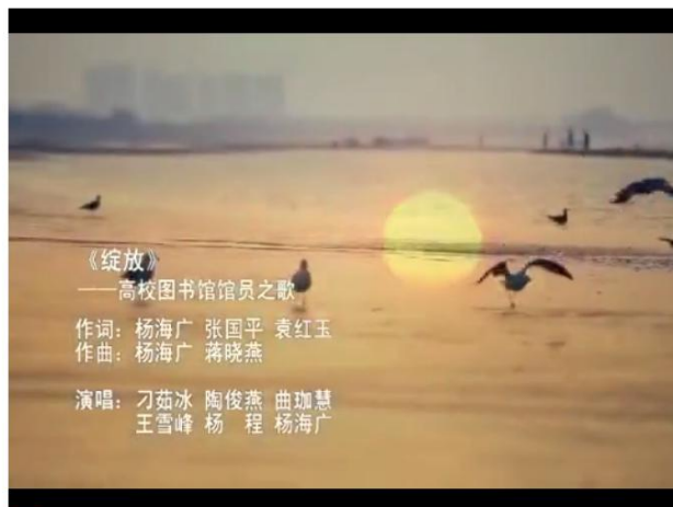
烟台大学 《绽放》 (一等奖)