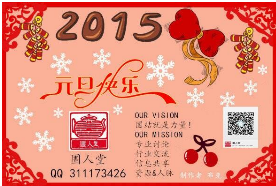
圉人堂 2015 年元旦贺卡（布克 制作）