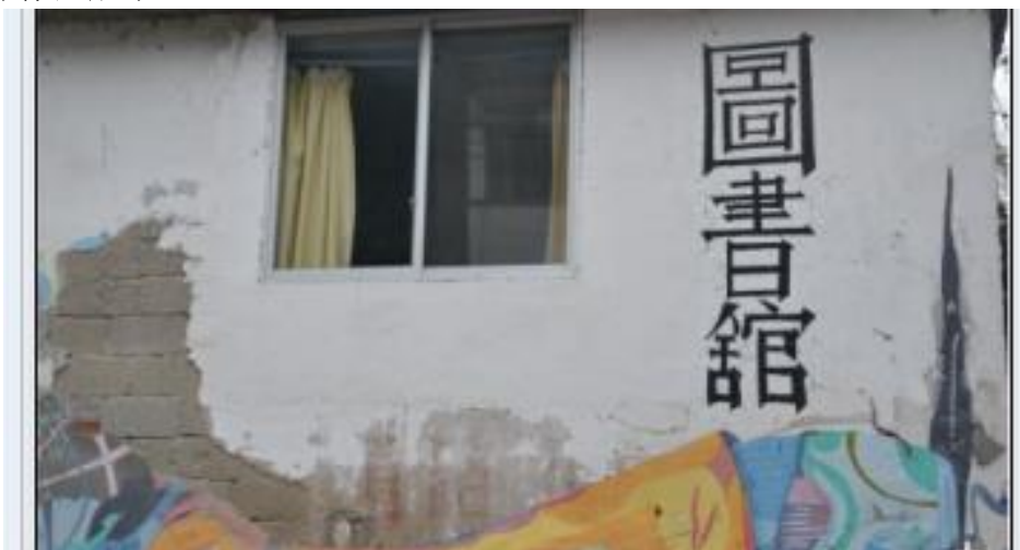
天外飞仙：“桂林兴坪老地方青年旅舍图书馆，拍摄于 2014 年 12 月 14 日。”