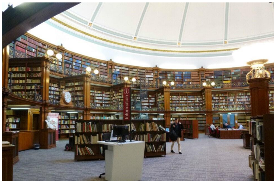
欣然读书：“英国利物浦中央图书馆，拍摄于 2014 年 11 月 25 日”