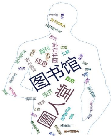
图谋 在围人堂QQ群中的专业画像