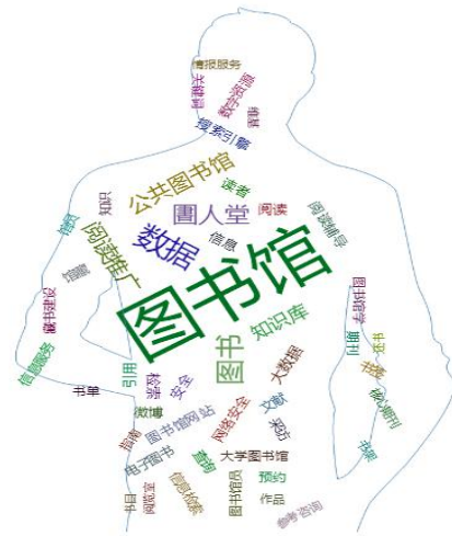
www 在围人堂QQ群中的专业画像