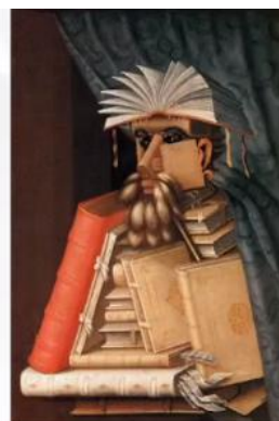
《图书馆员》(The Librarian) 一幅1556年的油画，作者为意大利画家朱塞佩·阿尔钦博托 (Giuseppe Arcimboldo)。