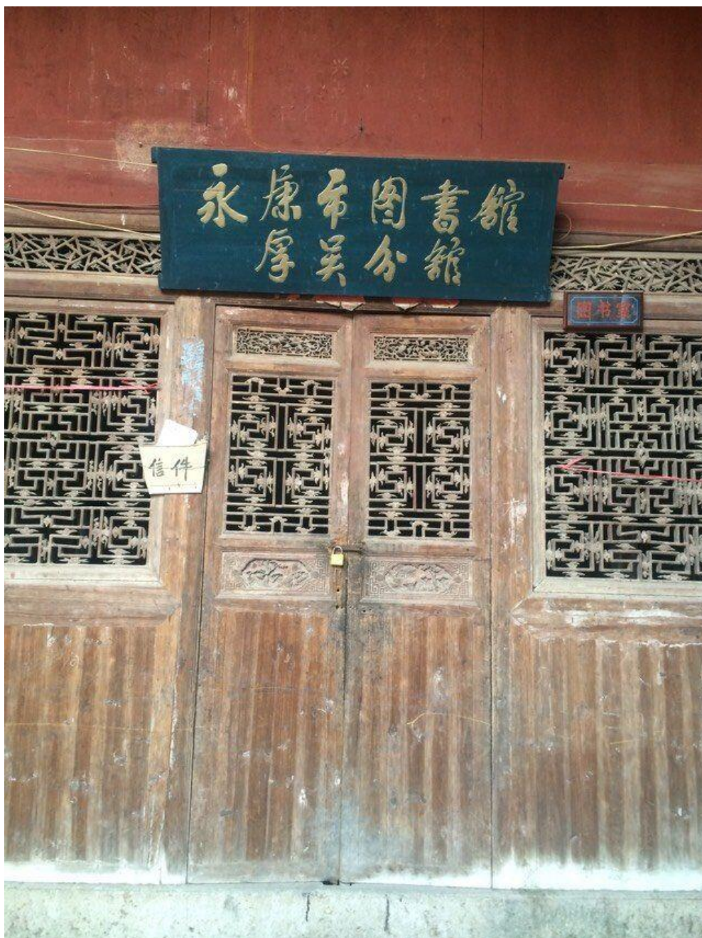
巧果：浙江省永康市图书馆厚吴分馆，摄于 2015 大年初