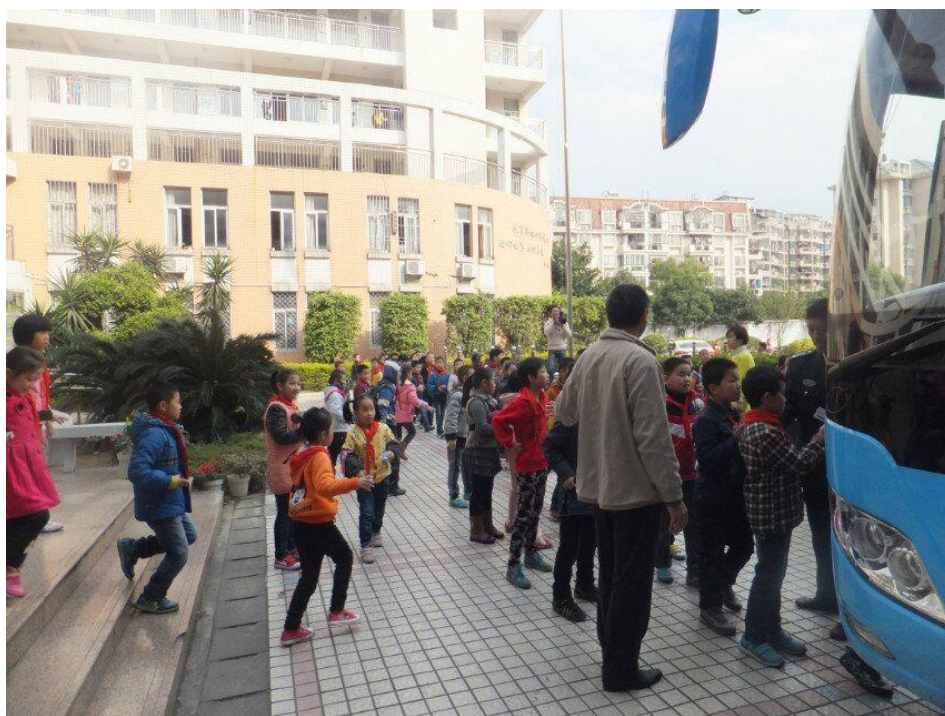
福建省图书馆汽车图书馆照片两张 上传者：映山红