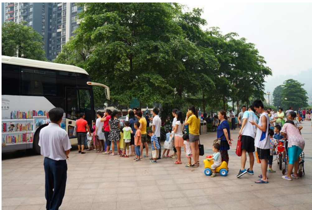
流动图书馆