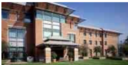
科学馆（1988 年建）