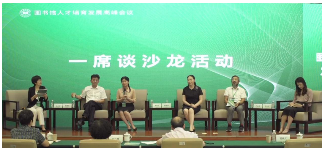
截图由书小弟提供

图谋：“程教授开头开得比较犀利。职称与待遇密切相关。职业生涯规划，职业发展，这是利益攸关的。当前的职称评审中的‘业绩导向’实际上是很虚的，所谓业绩实际并不是指工作业绩，更多的是各种‘背书’‘加持’，比如科研项目、获奖、主管部门采纳、标准规范制定等等，距离普通图书馆工作人员较远。人的发展（图书馆从业人员的发展），确实有待进一步重视。与谈专家视角看到一些问题，更多的问题，或许需要从业人员更好的鼓与呼。”书小弟：“工作业绩存在一个难以量化和评价的问题，需要出台相匹配的指标体系和评价体系。”