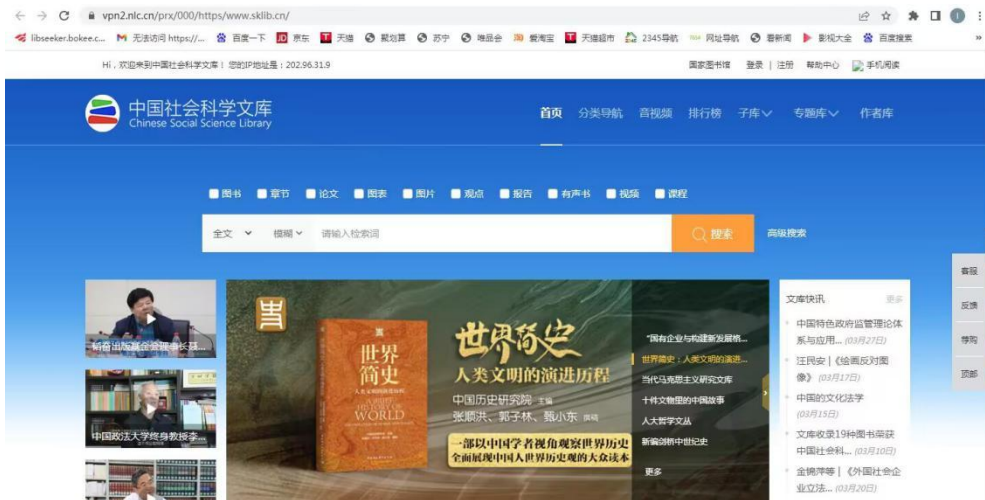
( 中国社会科学文库 , 国家图书馆提供注册读者互联网访问 )