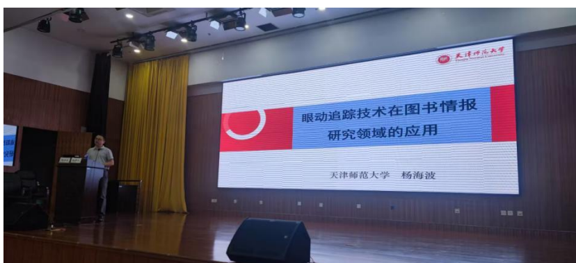
第十届图书馆学实证研究博士生学术会议