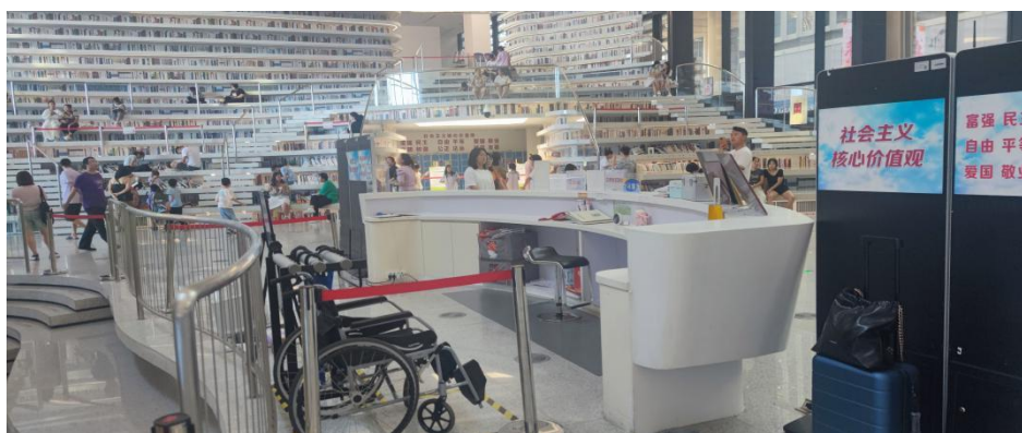
滨海新区图书馆·镜头下的图书馆