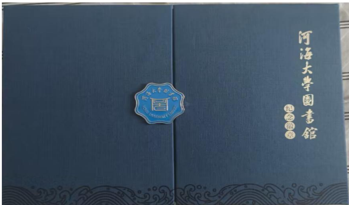
圖謀：河海大學圖書館紀念徽章

圖謀：“鄂鶴年主編.圖之美:南方科技大學圖書館的空間與特藏.北京:榮寶齋出版社, 2022.12.” 圖漾：“@圖謀 @圖謀 這是數學問題, 你那字數都对不上。” 圖謀：“這也屬於‘圖書館文創’範疇。” 圖謀：“@圖漾 我覺得不是單純的數學問題, 識別這類文字, 很容易不識數。實際上乍看一眼, 我是不計其數的, 直接猜。” 申扎小圖：“文創是文化創意產品的簡稱。” 圖謀：“猜完之後, 我還發現另有問題。印章得與文字連起來才是整體, 我刚开始誤認為印章部分可以以局部帶整體。印章內容為‘加州大學東亞圖書館’, 加州大學系統, 各家是否都用一樣的? 伯克利加州大學、洛杉磯加州大學、河濱加州大學等均有‘東亞圖書館’, 其它家是否也使用這個印章為 Logo。” 申扎小圖：“鼓勵開發兼具藝術性和實用性、適應現代生活需要、符合市場消費需求的文化創意產品。出處：關於進一步推動文化文物單位文化創意產品開發的若干措施。” 圖謀：“關於圖書館文創其實是有歷史的（長度、廣度、深度……），並不僅僅是‘這幾年’，這幾年受大環境影響更為活躍倒屬於實際情況。如果有更多成員參與交流與分享，更有利於增廣見聞。文旅融合大環境下，圖文博美好些方面（包括文創）相互學習借鑒，取長補短，各美其美，美美與共。” 麦子：“此類的印章不多見，一般是出於好玩在非正式情況下使用。加大系統這類管理不是太嚴。哈佛什麼的管的極其嚴格，任何學校 logo 都是需要通過一個正式辦公室批准的，所以，除了學校店裡賣的，下屬機構是不可以自己做的。最简单的例子是學校裡的筆記本之類，這類東西，我們是可以各部門自己印的，但記得哈佛不行，好像有紅色盾牌都不行。”