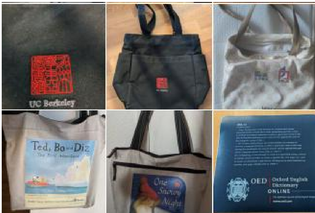
圖人分享的文創產品

麦子：“@biochem @biochem 我一般去书展什么的，最好的包往往是绘本书发布的帆布包。” biochem：“这类的包可以重复利用，环保。”图谋：“大大小小的图书馆，各有各的好（同时也会有各个各的‘不好’或‘苦衷’）。5月份与一位资深馆长交流，他告诉我‘其实每个图书馆都有特色，每个图书馆员都是好样的。’，我越来越赞同这个表述。”麦子：“很厚的帆布做的。” biochem：“质量不好的话，帆布包洗后会掉色。”麦子：“@biochem @biochem 从来不洗，好像也不用洗。” biochem：“用久了会脏的。”雨后彩虹：“喜欢书包装的东西多。” biochem：“双肩包最好。”雨后彩虹：“我觉得这包儿单薄了，从来不用。”图谋：“我喜欢的一件文创，DRAA年会上发的。假期里陪我走过好些地方。结实耐用，可挎可提。有内外二层拉链，内拉链可以放身份证、票据等小东西。每届DRAA会上的包是比较受欢迎的。”