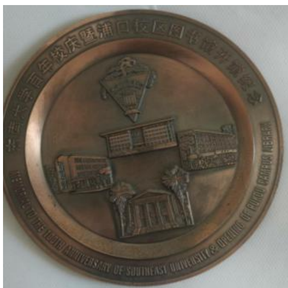
图谋：东南大学百年校庆暨浦口校区图书馆开馆纪念