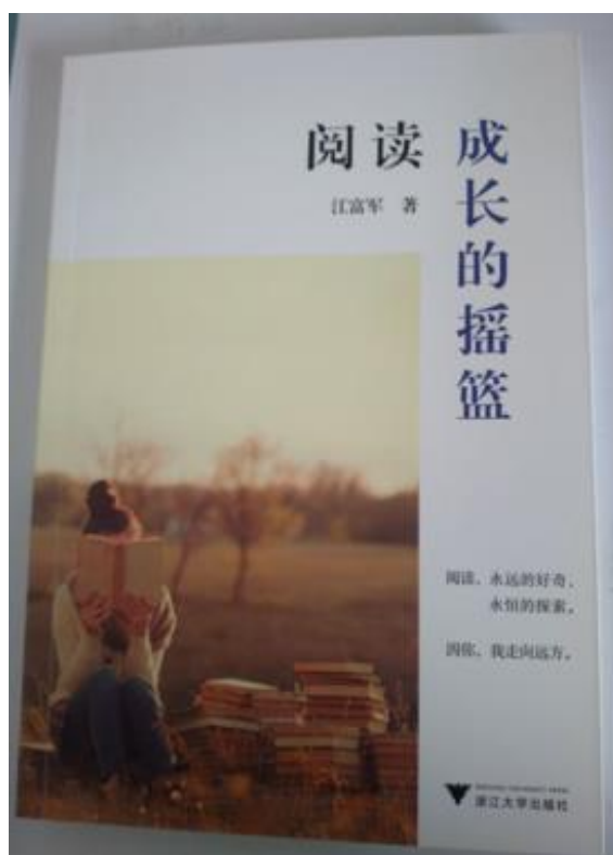
《阅读:成长的摇篮》封面（来源:抒情）

抒情：“[推荐一下我的新书。《阅读：成长的摇篮》以阅读理念、内容、方法与成长之间的关系为切入点，提出好奇、探索为阅读理念。结合学生生活实际，扣住当前学生成长中的迷茫点，从哲理、文学、历史、新闻等阅读视角切入学生的精神成长空间，把积累、交流、记录作为主要方式，结合实例探讨阅读对成长的重要作用。形式活泼，角度新鲜，对中学生阅读生活与作文提高均有较大价值。] http://t.cn/RANtHld 。”