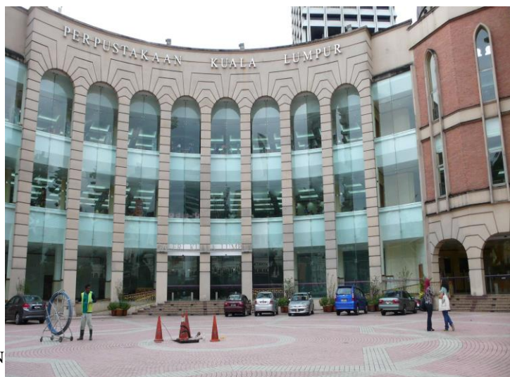
愿景(VISION): 定位 (MISSION)

As：“2010 年去马来西亚，在吉隆坡图书馆拍了几张照片，也想跟大家分享一下。”建筑很有特色，当中很现代，大面积的玻璃幕墙，采光很好。”进门在旁边圆形的红砖建筑，带一点古色古香，门口的大树很漂亮。”位置在吉隆坡的心脏地带，自由广场，周围是市政府，等等等等，马来西亚首府的政治文化中心。”玻璃幕墙看出去，是一些殖民时期的西方式建筑，周围环境都很有特色，很漂亮。”自助借还机。吉隆坡图书馆 2010 年就已经有自助借还服务。”