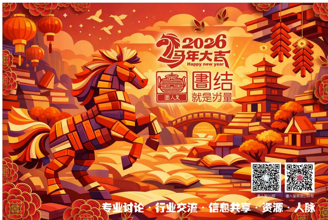
圖人堂 2026 年新年贺卡（成员“2014”制作）