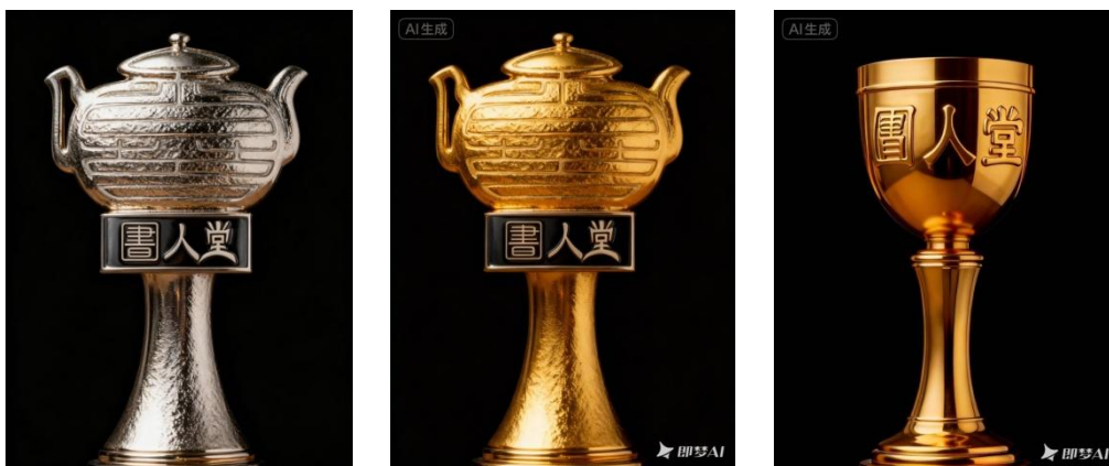
(用 Ai 做了一个奖杯)