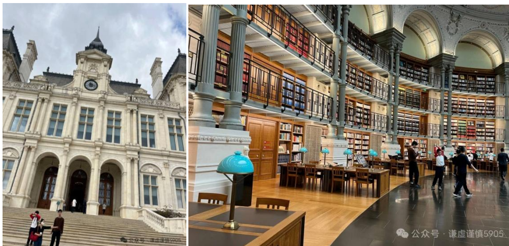
图片由杨*遥提供(华为大学·华为员工培训中心：华为松山湖园区)

止止稻人：“争奇斗艳。”持之以恒：“心中暖阳，生活发现处处美景！”图谋：“感谢大家参与分享！。闲暇时光，此类分享亦有益身心。期待更多成员积极参与。”