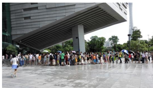
广州书童：“排队安检进馆。”