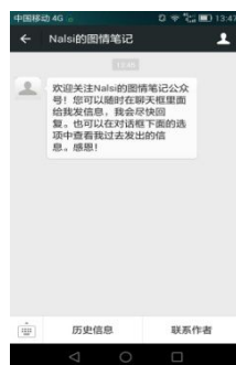
图谋：“‘nalsi 的图情笔记’ 微信订阅号。”