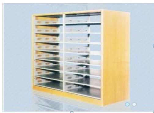
(供应报纸平放架)

天行健: “请教各位:所在馆的文艺类休闲杂志和非装订保存的旧报纸是如何处置?也可以小窗,谢谢!” /yy 呆保: “@天行健 我们是超低价向全校师生出售,最后剩下的当废纸卖。” 娜佳: “请教各位,关于艺术类图书,特别是美术类各种不同规则的册子的上架,整理和管理有什么好的经验吗。” 空空: “我们单位大的就没有排架。” 娜佳: “书库里一走到艺术类就闹心,太乱了,还不好找。” “擦着放,还是展开了放。” 云舞飞扬: “艺术书特别大的开本就放在该类书附近平放,其他都按照分类号排列。” 麦子: “@娜佳 我们有个放大尺寸书的地方,不光是艺术类的。” 娜佳: “@麦子 有大尺寸书的专用书架吗,大概什么样子的。” 麦子: “@娜佳 就是每格高度比较高。当然,我们另有一个地图馆,那是平放的。” 叶子: “画册,乐谱的大开本,我们是专弄了书架平放了,目前也没啥好办法。” 素问: “我们图书馆曾经买过这种样式的报纸架,放过期报纸的。” “尺寸很大。”