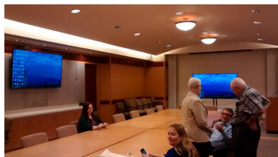
美国高校图书馆的会议室